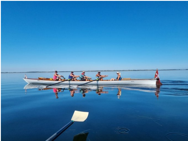
Motionsturneringen Marstal Roklub på tur i det Sydfynske Øhav