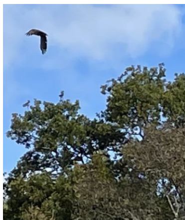
Havørn ved Esrum Sø