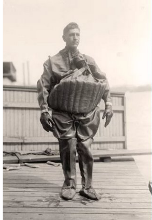
Redningsudstyr fra begyndelsen af det 20. århundrede

Benytter du egen oppustelige redningsvest, når du ror? Så vær opmærksom på, at redningsvesten skal tjekkes én gang om året mht. om patronen er OK, og vesten kan holde luft.