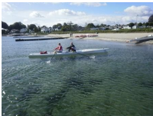
Men en 2-er Coastal Boat uden styrmand – det var måske mere interessant?