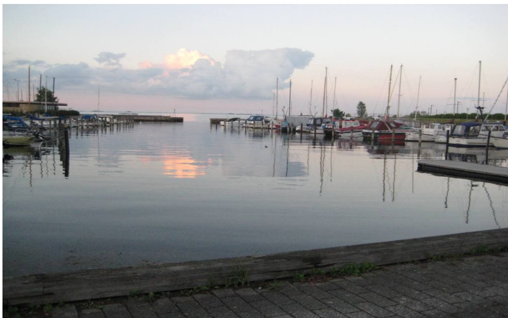
Stemningsbillede fra lygteroning kl. 22.00 ifm. Vi Ror Danmark Rundt