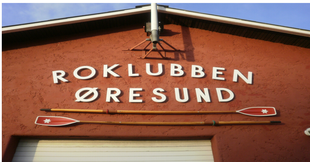
Roklubben Øresunds nye gavl