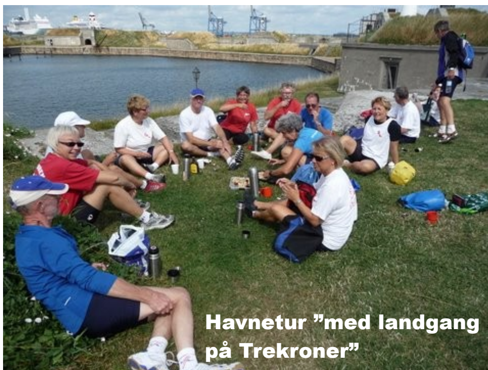
Havnetur "med landgang på Trekroner"