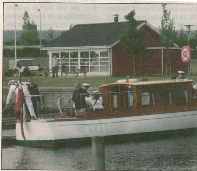
Hans Kongelige Højhed Prins Henrik overraskede alle, da han ankom til Kastrup Gl. Lystbådhavn, der normalt er forbudt at anløbe for gæster til havnen. Men en tidlig morgen skulle han videre med sin bil.