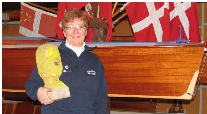
Det er Klabautermanden til venstre

Klabautermanden starter sin rosæson den 1. maj og fortsætter indtil slutningen af september.