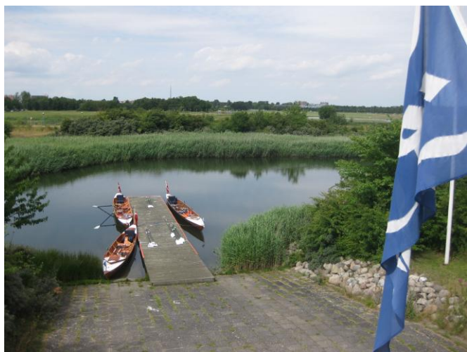
Udsigt fra Ishøj roklubs balkon

Det var som ny-roer min første langtur, og jeg glædede mig til at se nyt farvand, og prøve min udholdenhed af. Jeg havde travlt med at kigge til åren, men noterede dog, at vi kom gennem et dejligt afvekslende landskab både til styrbord og bagbord.