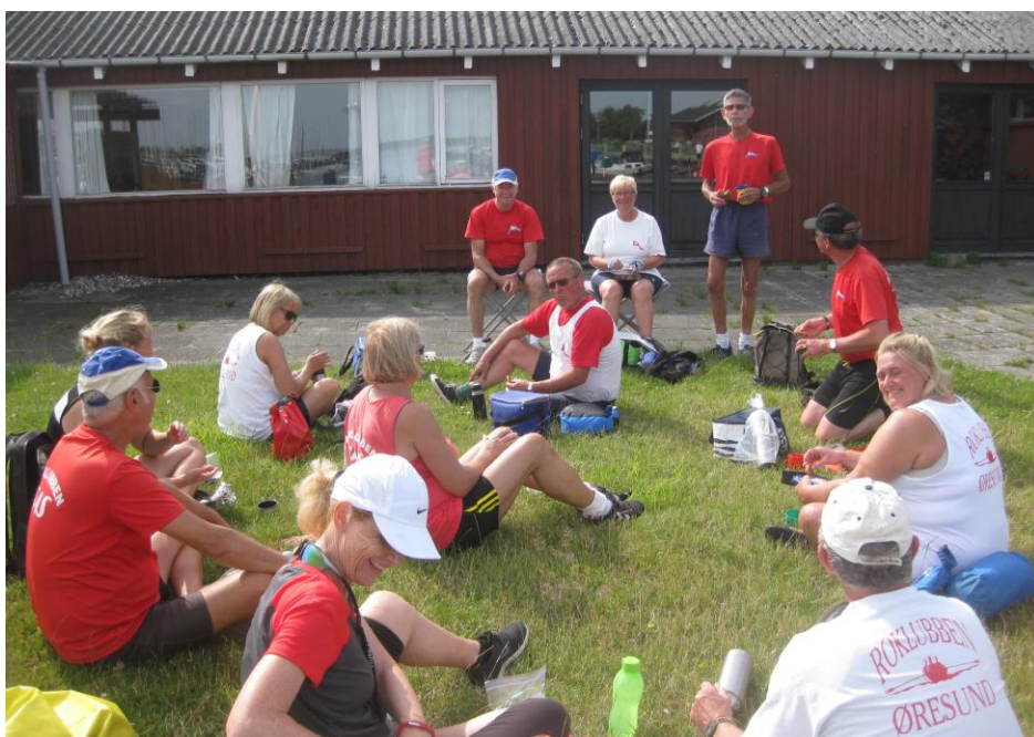
Eftermiddagskaffe Hvidovre Roklub