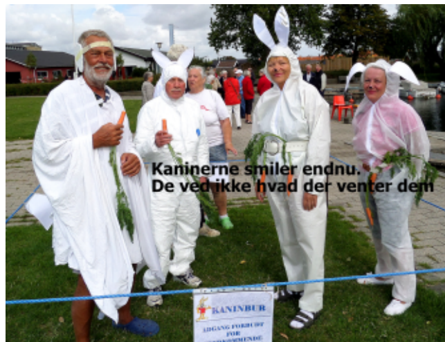
Kaninerne smiler endnu. De ved ikke hvad der venter dem