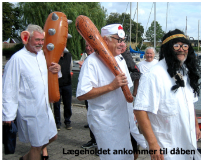
Lægeholdet ankommer til dåben

Der dukkede efterhånden flere af klubbens medlemmer op for at besigtige de 4 kaniner og komme med mishagsytringer om deres udseende og lugt og det manglede ikke på kommentarer til de stakkels kaniner.