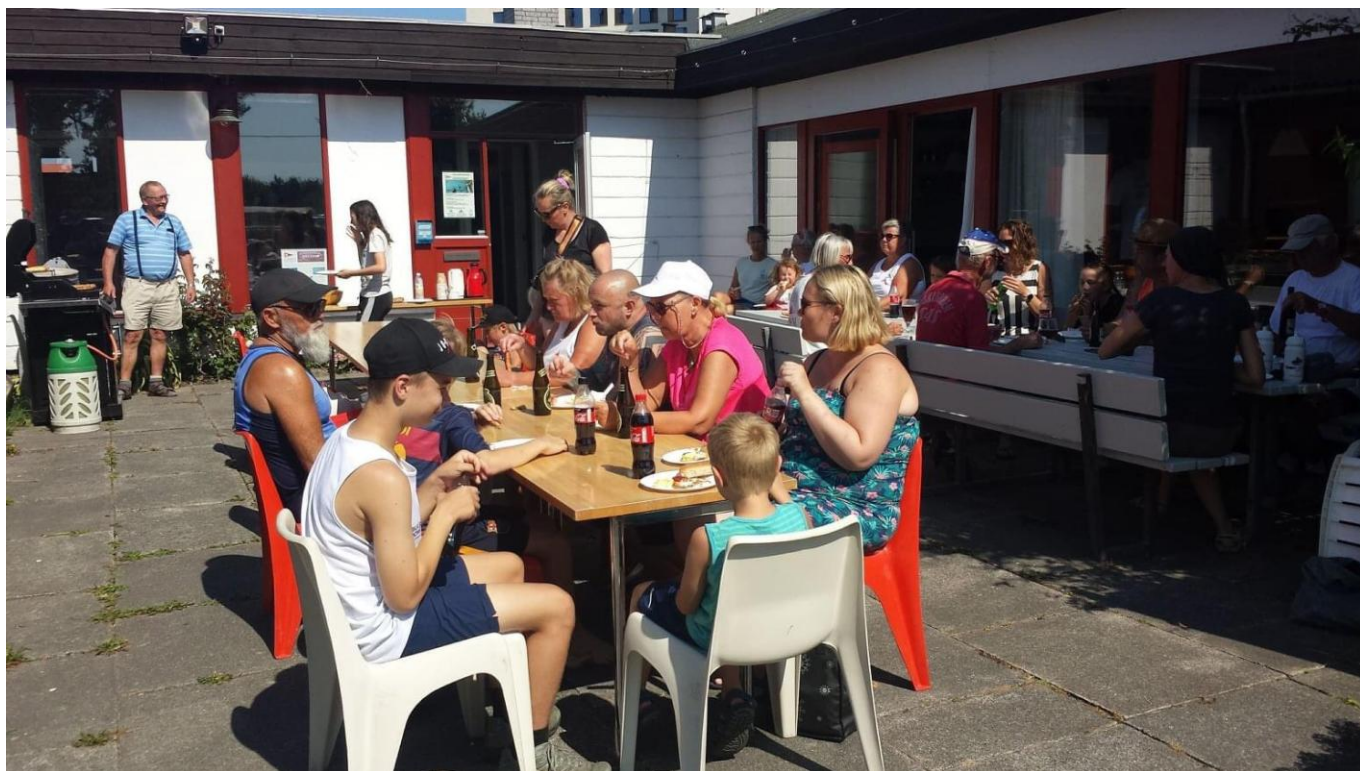
Mini-roerne hygger sig i gården