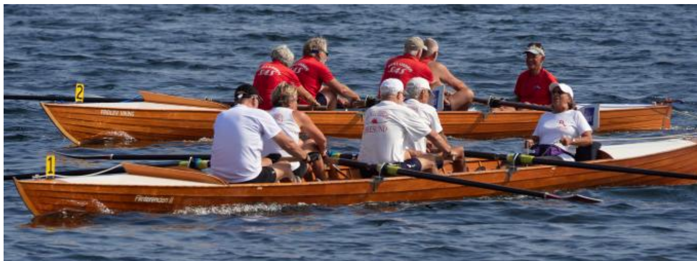
Øresund 60+ på vej mod førstepladsen.