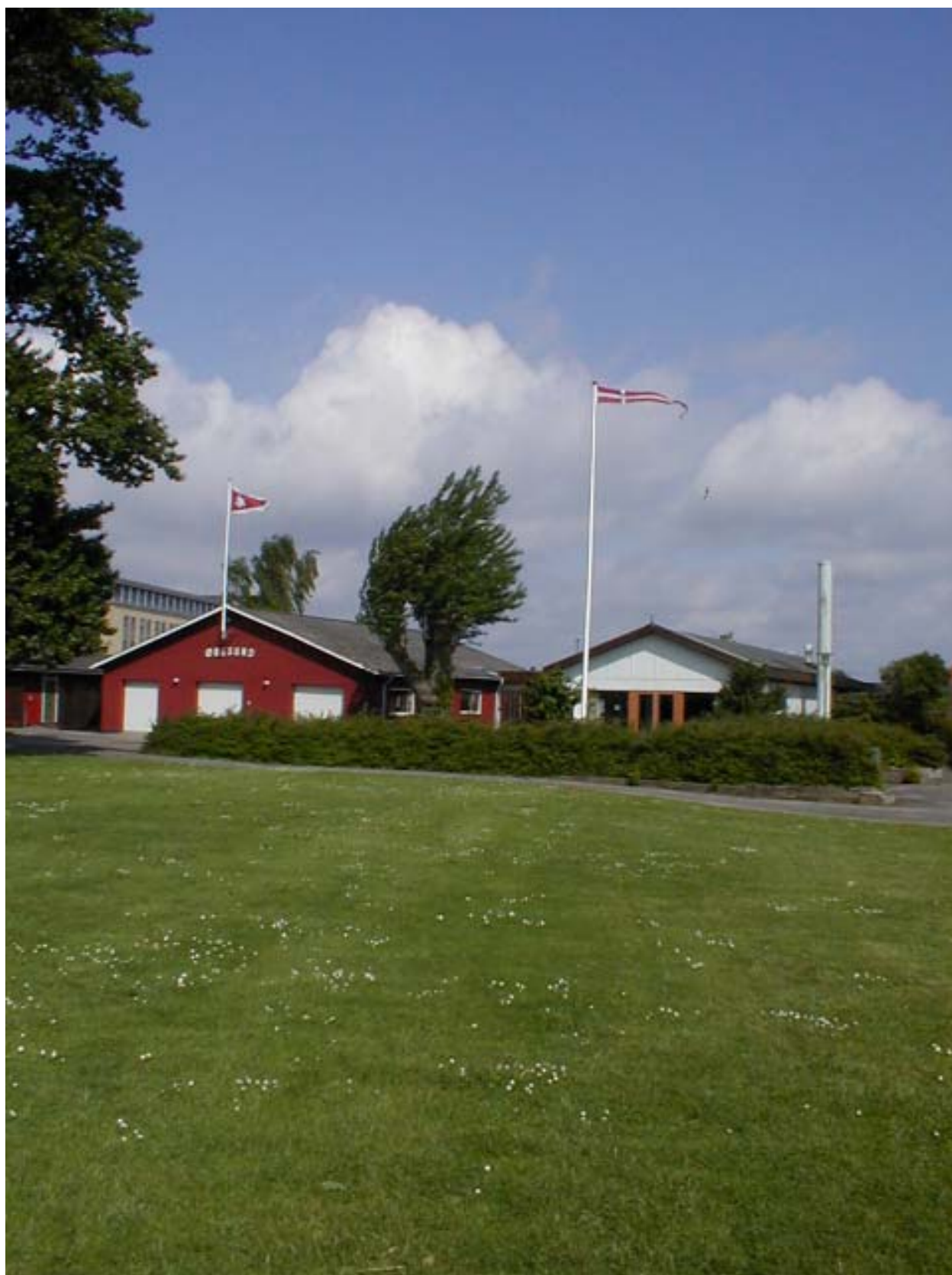
Roklubben Øresund - 4. juni 2005