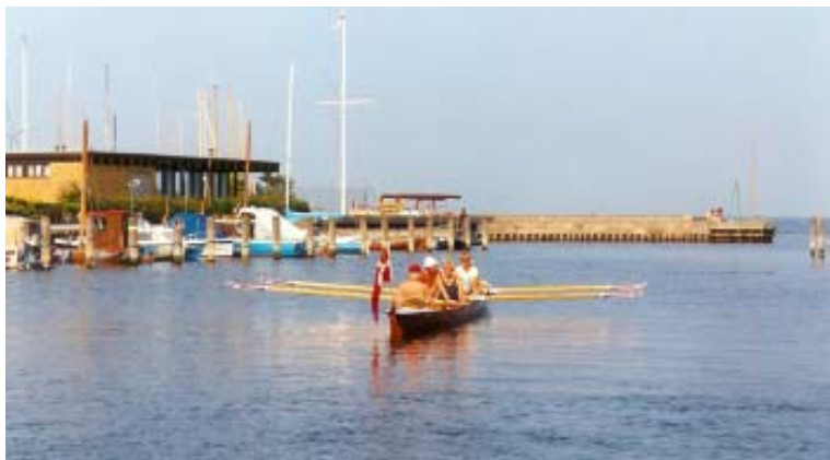
En flok glade gutter, der stævner ud fra Øresund.