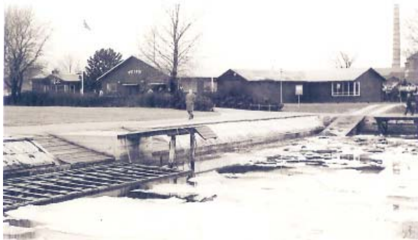
Standerhejsning med is på vandet i 1960'erne