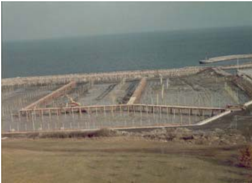
Billede fra 1986 der viser anden etape af den nye lystbådehavn umiddelbart før dæmningen brydes, og den nordlige del af det, der nu hedder Kastrup Strandpark, tages i brug (første etape blev bygget i 1977).

For di Roklubben SAS og Roklubben Øresund lå så tæt på hinanden har, der gennem årene været et særligt forhold de to klubber imellem. Klubberne har samarbejdet om mange ting omkring roning og altid fungeret socialt godt sammen. I 1991 blev SAS midlertidigt husvild og må flytte, idet lufthavnen inddragede det areal, hvor SAS var bosiddende. Klubhuset blev revet ned og SAS var husvild i ca. et år, indtil klubben på favorable vilkår kunne overtage Roklubben DS med lokaler m.v. I den periode, hvor SAS var