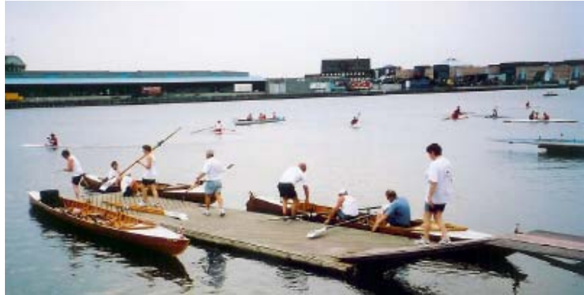
SPP i Københavns Havn

og ved, at der er 10 minutter til næste skift/drikketår. Fra at deltage med 2 hold (7 roere) i 1994, deltog Roklubben Øresund i 2004 med 5 hold (21 roere). Så Sved-På-Panden-Roning må siges at være en succes!