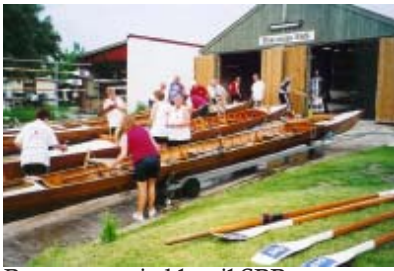
Roerne gør sig klar til SPP

Holdene er også blevet væsentlig mere skrappe! Roerne har dropet at ro taktisk, som de gjorde før, hvor de lagde ud med en svag tid, og derefter så let som ingenting forbedrede sig fra gang til gang og dermed vandt konkurrencen om forbedringspoints.