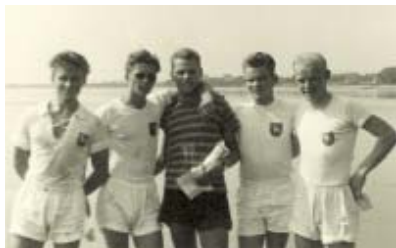
Kaproere fra Øresund

medlemmer dukker frem, og dermed øges interessen om kravet om udvidelse af kaproningsmulighederne i Øresund.