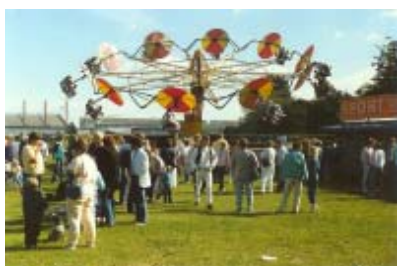
Havnefest ved Roklubben Øresund

Første Havnefest efter dette møde var egentligt relativt beskeden. Efter endnu en glamourøs dåb kunne folk frekventere et par tombolaer og en åben bar.