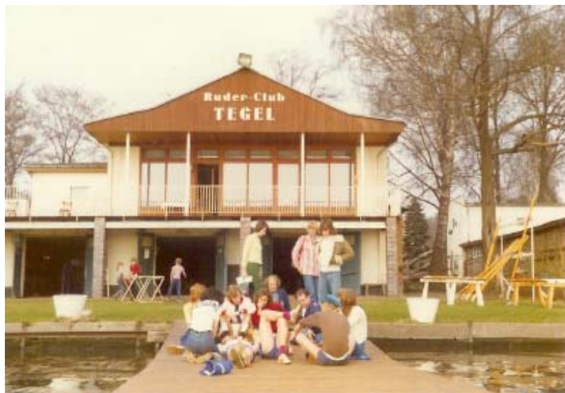
Øresundere i Berlin i 1970'erne

Amagerregatta (kaproning mellem roklubberne på Amager) og Venskabs Match (VM) med vores nabo Roklubben SAS (som dengang lå ved lufthavnen, hvor Netto ligger i dag) genoptages efter byggeperioder i begge roklubber, men de sportslige