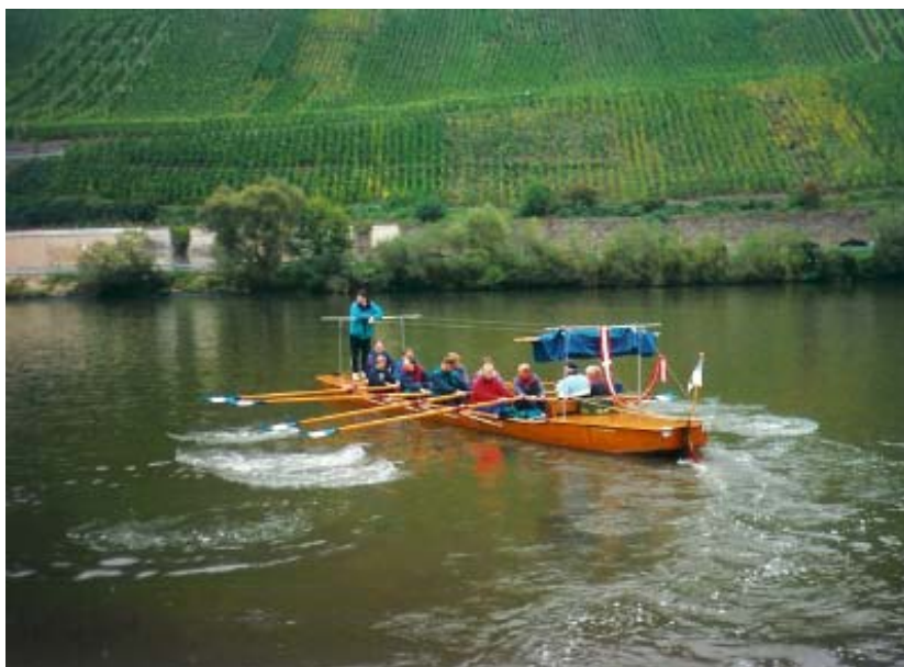
Barketur med Die Dänemarksfahrer

Som medlem af DD har man også mulighed for at leje de udstationerede både, som DD råder over, og som ligger på de