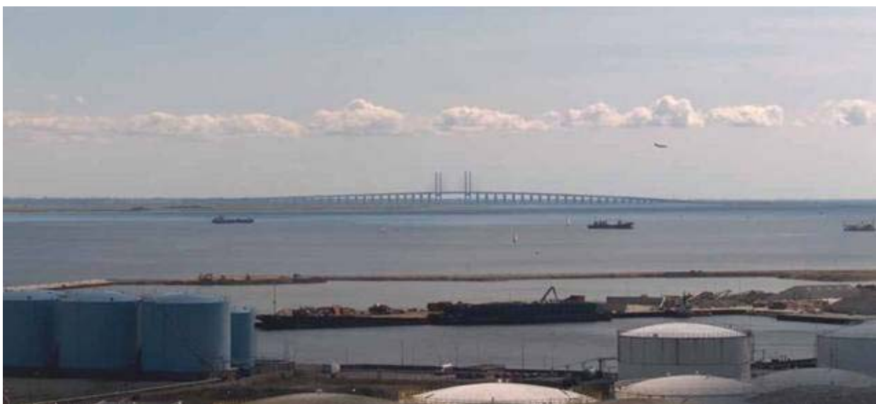
Øresundsbron set fra Amagerværket.

„Øresundsbron“ indvies endeligt den 1. juli år 2000 – bemærk den officielle stavemåde, der er sammensat af svensk og dansk. I forbindelse med at lufthavnsrelateret industri skyder op på det nyindvundne område (Catering, Luftfragt, DSB's garageanlæg, mm.), etableres