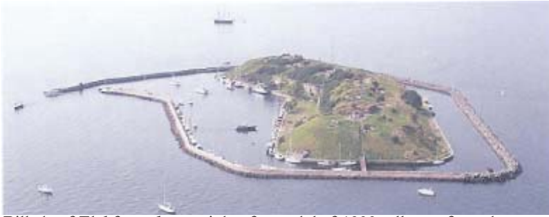
Billede af Flakfortet bygget i den første del af 1900 tallet set fra syd

oaser, der bliver benyttet til rekreative formål. I 1980 fik vi tildelt et lokale i kasamaterne på Flakfortet mod en symbolsk betaling. (Lokalet skulle Øresund selv sætte i stand). Dette lokale var meget fugtigt og blev ikke benyttet særligt meget. I 1987 fik vi et andet og bedre lokale. Dette lokale lå i den sydlige ende af fortet og var efter istandsættelse et udmærket lokale der kunne huse ca. 20 roere. Lokalet blev i en årrække benyttet flittigt af os og andre roklubber i københavns-kredsen. På et tidspunkt skete der en ændring i ejerkredsen af Flakfortet. Dette førte til prisstigning på lokalets leje til et niveau, der ikke kunne bæres af Øresund alene. Da hverken kredsen eller andre klubber ønskede at bidrage blev lokalet opsagt i 1995.