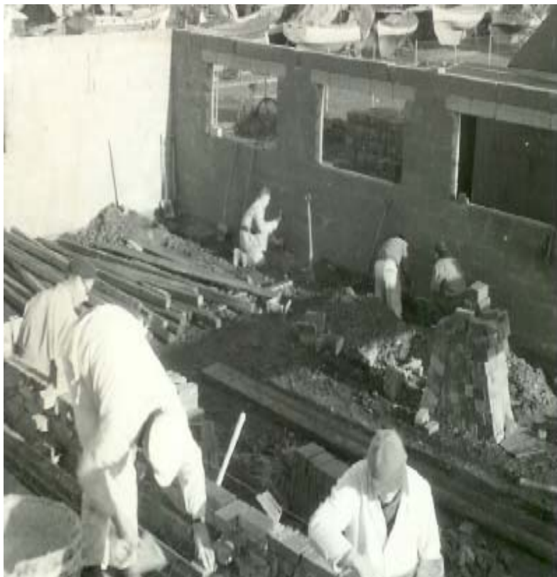
Der bygges på det røde hus!

Resultatet udeblev ikke, selvom det blev et hårdt job for det fastehold, som på generalforsamlingen i 1968 påtog sig at færdiggøre byggeriet til standerhejsningen i 1969.