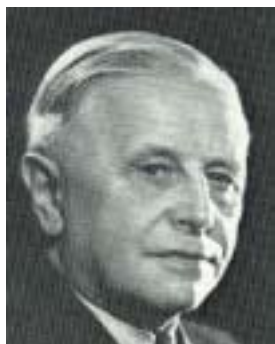
C. A. Markers 1930-1935 1938-1940