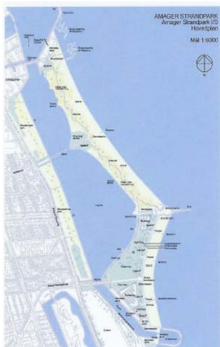
Drømmen om Iido de Amager.

Ved Sundby Havn er der blevet opført et søkulturhus, som det er meningen skal danne ramme om forskellige søsportslige aktiviteter. Der har været en del problemer i opstartsfasen. Det er meningen, at huset skal være bemandet af en slags bestyrer, der skal medvirke til at udvikle aktiviteterne i og omkring huset. Det har indtil nu ikke været muligt at finde de rigtige personer i dette samspil, men der er bygget et flot hus - rammerne er i orden, så må man håbe at aktiviteterne kommer til at fungere.